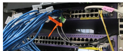
Figure 4: Edge switches.

Figure 2 から Fig. 4 の管理されたスイッチは基本的に冗長を組んで運用しているため、2 台が並んで設置されている。第 2 期更新までは ESRP(Extreme Standby Router Protocol) [6] と EAPS(Ethernet Automatic Protection Switching) [7] を組み合わせて運用していた。ESRP が L3 レベル (IP レベル) の冗長であり、EAPS は L2 レベル (データリンクレベル) の冗長である。従って、隣接機器に異常があった場合には EAPS で瞬時の切り替えを行い、迂回路を作り出す必要がある場合には ESRP で数秒程度の切り替えを行っている。第三期更新からは Fabric Connect [8] という SPB(Shortest Path Bridging) をベースにしたプロトコルを導入しつつあるが、対応機種でそろえる必要があるため、現時点对応しているコアスイッチ周辺の中核部分のみの利用に限っている。