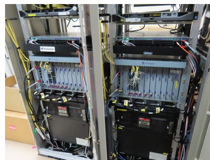
Figure 2: Core switches.

Figure 3 は実体としては 1 段目のエッジスイッチであるが集約スイッチ (X690-48x) と呼んでいる。基本的に各施設に 1 組だけ存在して、コアスイッチと後述のエッジスイッチの間の通信を担う上位スイッチである。