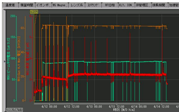
図6：運転中のデータ（赤：電子銃真空度、橙：入射電圧、青：ビーム平均電流）

電子銃交換から半年以上経過した2006年4月ごろから運転中に電子銃付近の放電によるものと思われる真空悪化が発生するようになった。その際真空インターロックにより電子銃の電源が落ち、再開に10分以上必要となっていた。その後、発生頻度が日に3~4回だったのが、約2時間毎に1回にまで増加した(図6)。真空悪化が一時的であることからインターロックの設定を緩和して、電子銃の電源を落とさないようにしたところ、発生頻度が低下し始め週に1~2回しか発生しなくなった。明確な原因が不明であり、今までのインターロックの設定値が高すぎた可能性もあるため、現在はこの状態のまま運転している。