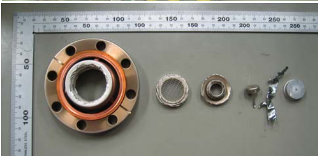
図2 (上) : 更新後の電子銃・入射系