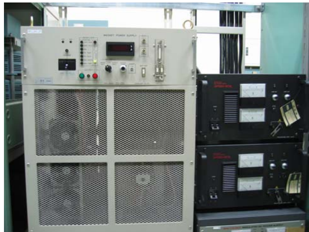
図4 : KEKの支援で設置された安定化電源

KEKの大学連携支援事業の援助を受けて2006年3月に行った(図4)。更に同7月に安定化/非安定化電源の切り替えを可能とする改造を行った。安定化の効果は今夏の放射光実験で確認の予定である。