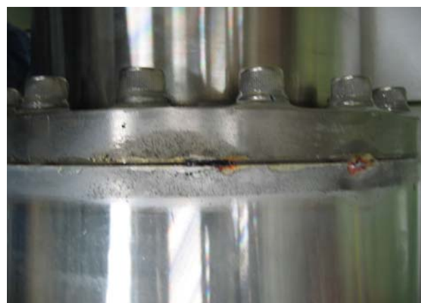
図5 : 損傷したシール部

2006年1月に運転開始より使用していた位相調整器を更新した。調整精度が3桁から5桁になり、プリセット機能が搭載されたため、パラメータの再現性が向上した。また同2月にNo.2 Waterloadを更新したが、使用中にフランジのシール部でマイクロ波によるものと思われる放電が発生し、シール部を損傷した(図5)。その損傷箇所から充填しているSF 6 ガスが漏れており、現在製作者の下で修理中である。