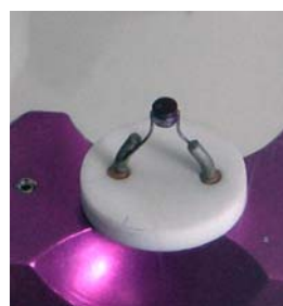
図3 Single Crystal LaB6カソード(φ1.75mm)

目標とした。このため極めて小さなカソードを用いることとした。このため必要な電流値300mAを確保するために、放出電流密度の大きなLaB6カソードを採用した。図3にLaB6カソードの写真を示す。低エミッタンス化のもう一つの条件として、引き出し電界強度をできるだけ高くするため、