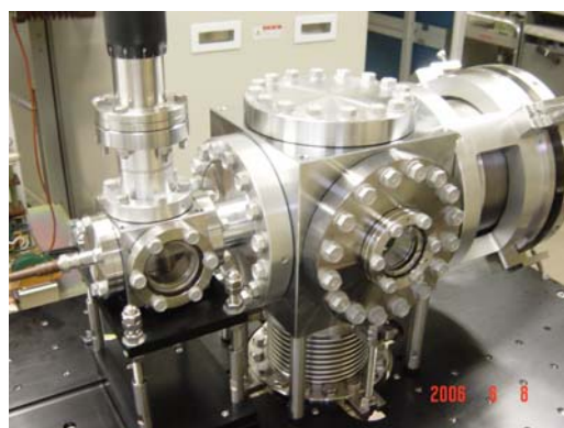
図2 低エミッタンス熱陰極DC電子銃

現在稼働中の電子銃はエミッタンスが大きく、加速中に電子ビームをこぼしてしまい、過大な放射化を引き起こす要因になっている。そこで、2005年4月から低エミッタンスの熱陰極DC電子銃の開発研究を開始した。図2に開発中の電子銃の写真を示す。基本的な構造はエミッタンス増加を招くグリッドを用いず高電圧パルスのみ印加により、電子ビームを発生させる。目標はこれまでの電子銃と置き換えが可能な仕様とした。加速電圧については全体の小型化を狙い50kVとした。また、エミッタンスについては、これまでに比べて格段に小さくすることを